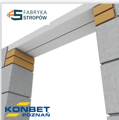
SBN 72/120. Wysokość: 72 mm. Szerokość: 120 mm. Rozpiętość: od 1,2 do 3,3 m. Klasa betonu: C40/50. Waga: 21 kg/mb. Ilość na palecie: od 27 do 36 szt.