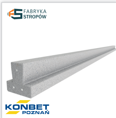
System Stropowy MASTER. Rozpiętość stropu: maks 9,3 m. Wysokość konstrukcyjna stropu: w zależności od wariantu pustaka. Grubość nadbetonu: w zależności od wariantu pustaka. Osiowy rozstaw belek: 60 cm. Waga 1 m 2 stropu: w zależności od wariantu pustaka. Przenoszone obciążenia: do 30 kN/m 2 . Wysokość belki: 11 cm. Szerokość belki: 12 cm. Długość belki: maks 9,3 m. Klasa betonu: C50/60. Waga: 23 kg/m 2 .