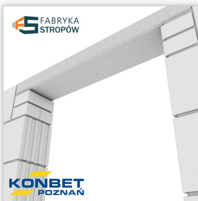
SBN 72/180. Wysokość: 72 mm. Szerokość: 180 mm. Rozpiętość: od 1,2 do 2,4 m. Klasa betonu: C40/50. Waga: 31 kg/mb. Ilość na palecie: od 18 do 24 szt.