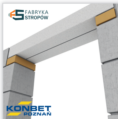
SBN 100/120. Wysokość: 100 mm. Szerokość: 120 mm. Rozpiętość: od 1,2 do 4,2 m. Klasa betonu: C40/50. Waga: 30 kg/mb. Ilość na palecie: od 18 do 27 szt.