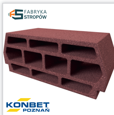
Strop Teriva 24/60 BASE 10-KOMOROWY TERMO. Rozpiętość stropu: maks 7,2 m. Wysokość konstrukcyjna stropu: 24 cm. Grubość nadbetonu: 3 cm. Osiowy rozstaw belek: 60 cm. Waga 1 m 2 stropu: ok. 228 kg. Klasa energetyczna: A (R=0,874). Wysokość pustaka: 21 cm. Długość pustaka: 24 cm. Szerokość pustaka: 48 cm. Wariant produktu: keramzyt lub beton. Waga pustaka: 13 kg/szt. Ilość na palecie: 60 szt.