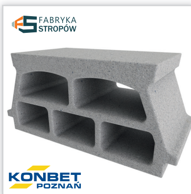
Strop Teriva 5-KOMOROWY TERMO 24/60 PLUS i 28/60 PLUS. Rozpiętość stropu: maks. 7,5 m. Wys. kontr. stropu: 24 lub 28 cm. Grubość nadbetonu: 0 lub 4 cm. Osiowy rozstaw belek: 60 cm. Waga 1 m 2 stropu: 257-359 kg. Klasa energetyczna: A (R=0,844). Wysokość pustaka: 24 cm. Długość pustaka: 24 cm. Szerokość pustaka: 48 cm. Wariant produktu: keramzyt lub beton. Waga pustaka: 14-15 kg/szt. Ilość na palecie: 48 szt.