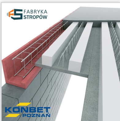
Zespólny Strop Gęstożebrowy VECTOR. Rozpiętość stropu: maks. 7,2 m. Wysokość konstrukcyjna stropu: 15, 20, 24 cm. Grubość nadbetonu: w zależności od wariantu stropu. Szerokość płyt: 60 cm. Waga 1 m 2 prefabrykatu: ok. 115 kg. Przenoszone obciążenia: 4-10 kN/m 2 . Wysokość płyty: 4 cm. Klasa betonu: C20/25. Dźwiękoizolacyjność: do 60 dB.