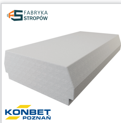
Strop Teriva 24/60 LIGHT. Rozpiętość stropu: maks. 7,2 m. Wysokość konstrukcyjna stropu: 24 cm. Grubość nadbetonu: 4 cm. Osiowy rozstaw belek: 60 cm. Waga 1 m 2 stropu: około 188 kg. Klasa energetyczna: A+ (R=3,088). Wysokość pustaka: 20 cm. Długość pustaka: 100 cm. Szerokość pustaka: 48 cm. Waga pustaka: 1,6 kg/szt. Ilość na palecie: 16 szt.